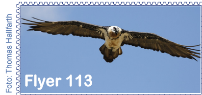
Abbildung aus dem Buch »Oh mein reicher Altai« von Stephan Ernst (siehe Angebot in diesem Flyer)