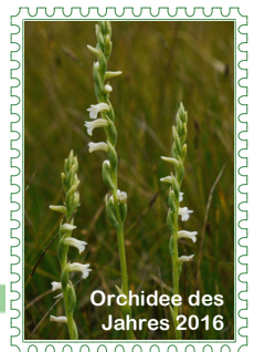
Orchidee des Jahres 2016